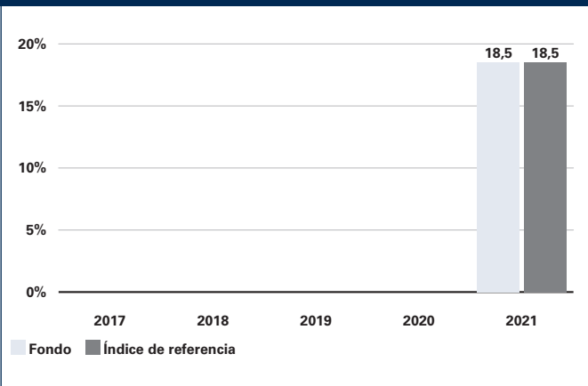
Global Growth Clase I2-JPY en JPY