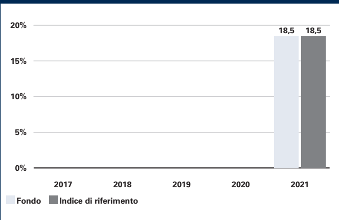
Global Growth Classe I2-JPY in JPY